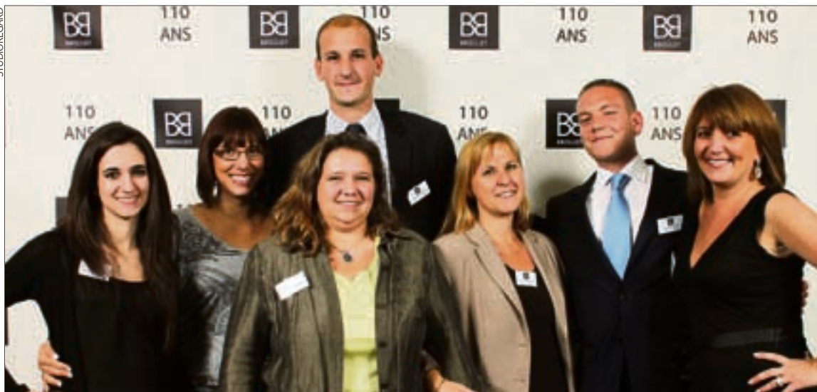
▶ Quelques collaborateurs Brolliet de la gérance.