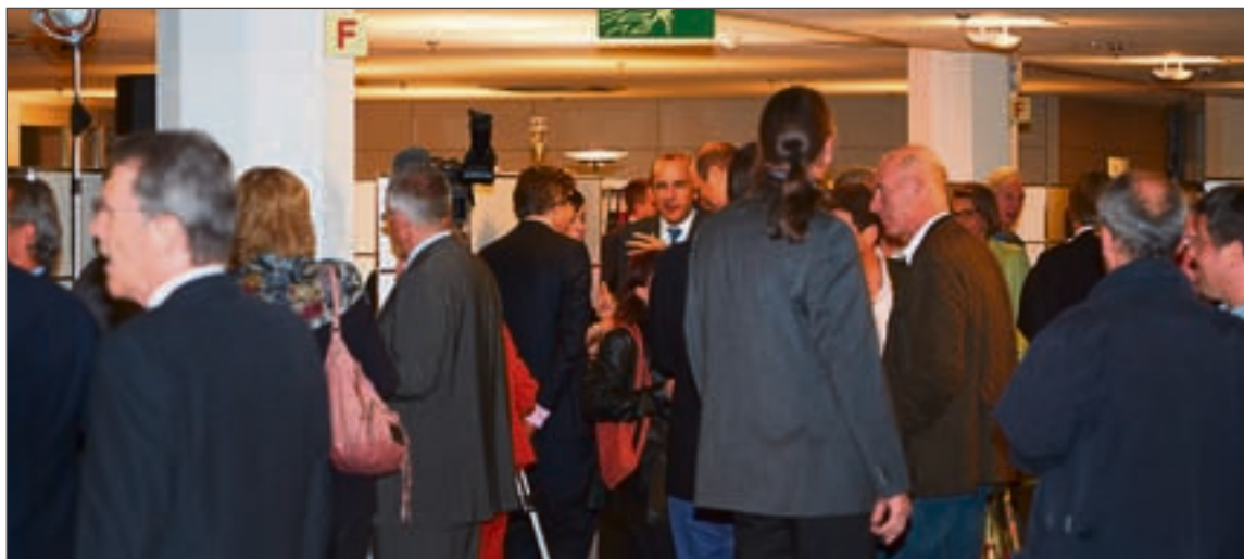
► Ambiance avec les propriétaires d'immeubles en gestion chez Brolliet.

est passée, à l'instar de tout le secteur immobilier. Pour mieux s'en rendre compte, les quatre membres du Conseil de direction ont souhaité en donner un aperçu. Certains exemples sont parlants: voilà dix ans, l'état des lieux se faisait à la main. Aujourd'hui, tout est notifié sur