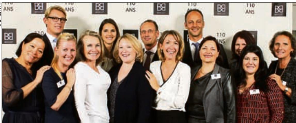
▶ Une partie du pôle commercial.