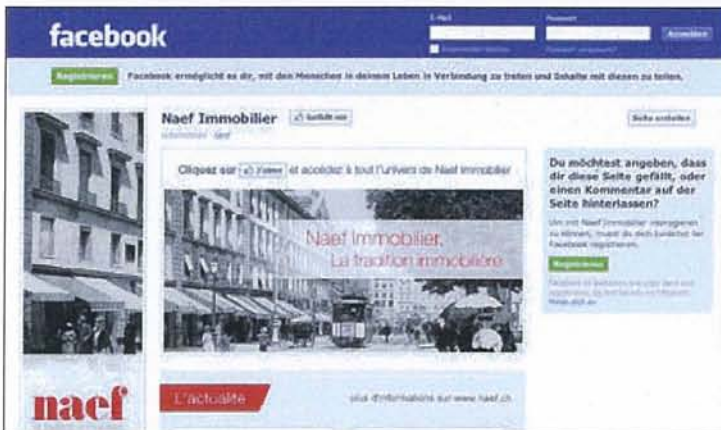
Le site internet de Brolliet (photo du haut) est l'un des mieux classés dans l'enquête de MAJ Consulting. Naef & Cie est l'une des rares agences immobilières à Genève à être présentes sur les réseaux sociaux (bas).

«La mise en place d'une stratégie digitale globale permettrait aux régies de tirer la quintessence des efforts qu'elles ont engagés»